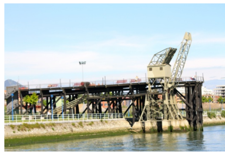
Cargadero de la Franco-Belga

Como vemos no es extraño querer defender nuestro "Poste del Cable" como patrimonio histórico industrial y vestigio de una actividad económica transformadora, ya obsoleta, que explica a la sociedad que aquí hubo un pasado industrial. En otros lugares de España y del mundo esto se lo toman muy en serio y se recupera este patrimonio. Es el caso del cargadero de La Franco Belga en Barakaldo, que tras el proceso de planificación estratégica de Bilbao Ría 2000, se reconstruyó este cargadero de la compañía Franco-Belga que, además había sufrido un incendio en año 2000.